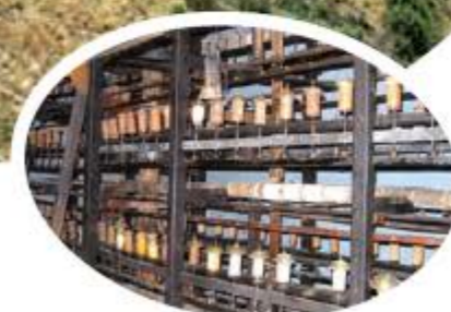
Machine moulinage (Ecomusée Chirois)