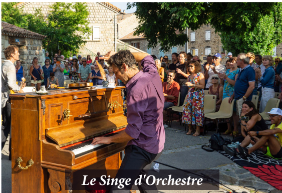
Le Singe d'Orchestre