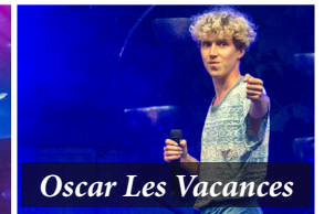
Oscar Les Vacances