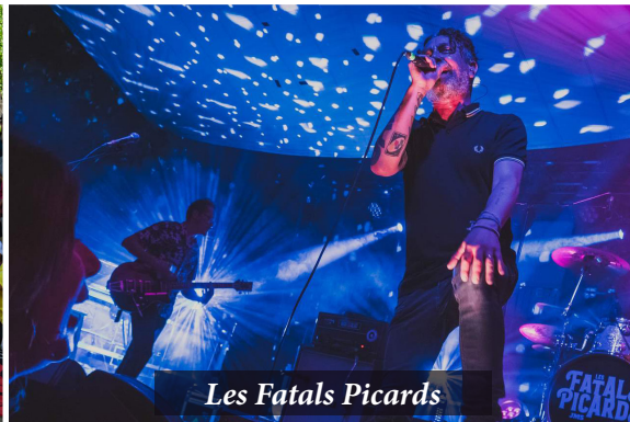
Les Fatals Picards